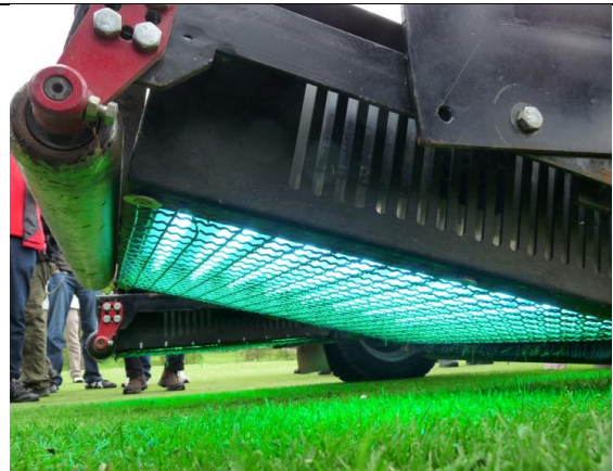
Abb.4: Belichtungseinheit des UVC-Gerätes.