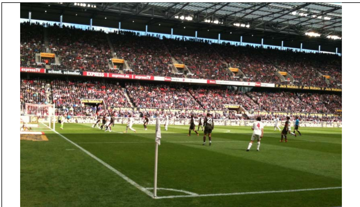
Abb. 1: Qualitätsziele eines Fußballrasens: dicht und scherfest.