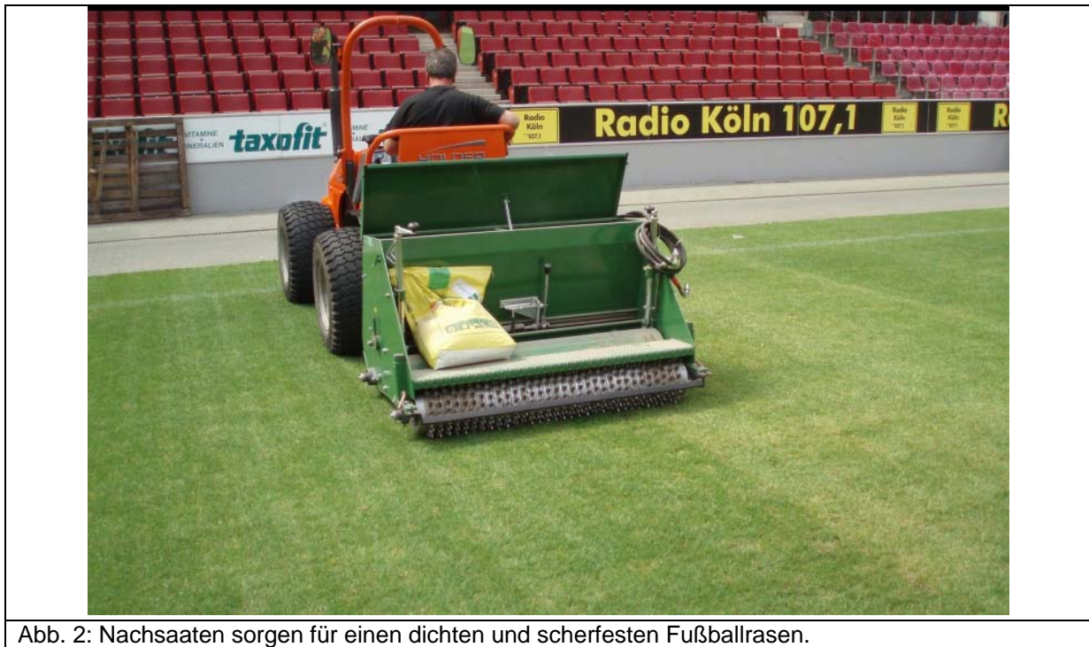
Abb. 2: Nachsaaten sorgen für einen dichten und scherfesten Fußballrasen.

In einigen Stadien wurde die Rasentragschicht ausgetauscht, um die Funktions- und Vegetationseigenschaften zu verbessern. Einem Trend aus Großbritannien folgend, wurde in den ersten Arenen die Rasentragschicht mit synthetischen Bestandteilen zur Erhöhung der Scherfestigkeit und Ebenflächigkeit armiert.