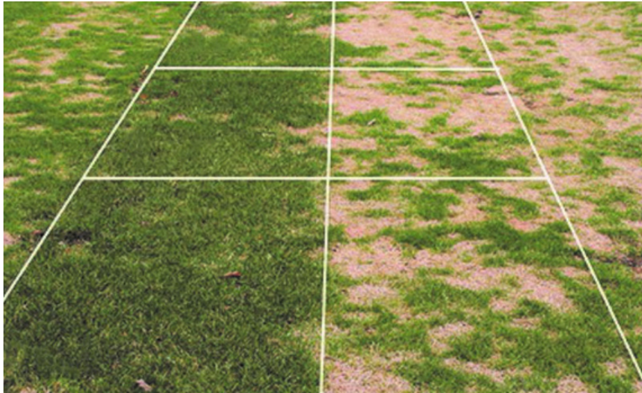
Abb. 4: Verbesserte Krankheitsresistenz ( Microdochium nivale ) bei tetraploiden Lolium perenne Sorten (li.) gegenüber diploiden Sorten nach DLF in WALL (2019).

Bezüglich Winterhärte und Krankheitsresistenz zeigen tetraploide Sorten von Lolium perenne in skandinavischen Versuchen deutlich bessere Ergebnisse als diploide.