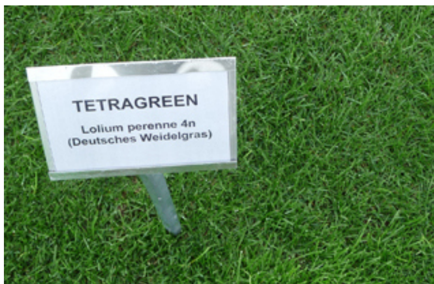
Abb.2: Tetraploide Lolium perenne -Sorte im Versuch.

Die Züchtung angepasster, modernen Rasengräser hat sich in den letzten Jahren drastisch verbessert, das wird an der Anzahl (43) der sehr guten Lolium perenne -Sorten sichtbar. Unter den veränderten Klimabedingungen rücken die tetraploiden Weidelgräser stärker in den Fokus für die Nutzung im Strapazierrasen. Insbesondere zur Verbesserung der Pflanzenbestände nach einer längeren Trockenheit bieten sich tetraploide Sorten von Lolium perenne für die Nachsaat an. Als Beispiele aus der Sortenliste sind zu nennen: DOUBLE/ TETRAGREEN/ neu TETRASPORT/ TETRABOOM/ TETRAFAN/ oder TETRAGON.