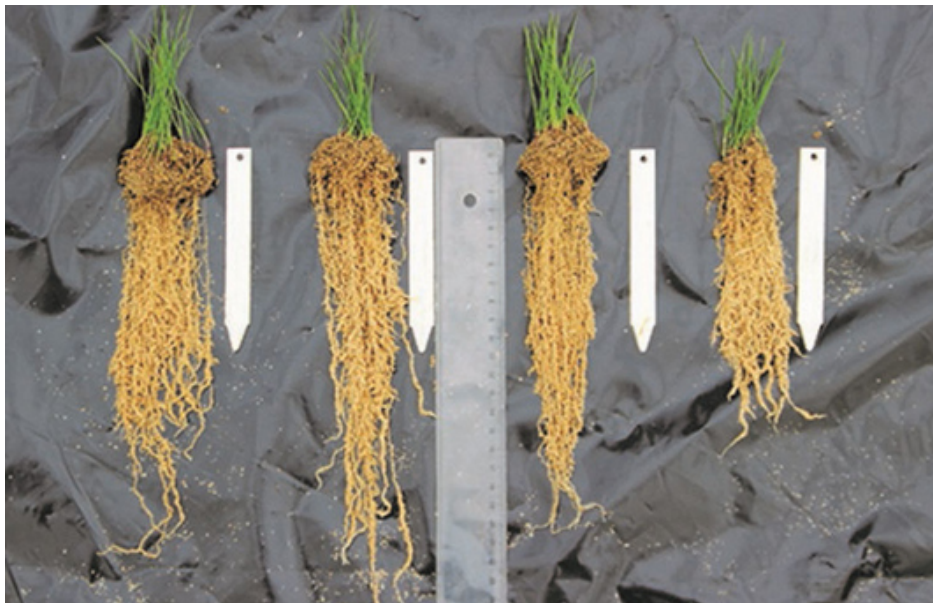
Abb.3: Untersuchung der Wurzeltiefe von tetraploidem Lolium perenne (li.) und diploidem Lolium perenne (re.) durch DLF International Seeds (WALL, 2019).

Auf der Suche nach immer größerer Leistung der Gräser für den Strapazierrasen bieten die tetraploiden Sorten der Weidelgräser echten Fortschritt. Laut DLF (2023) ist die Stärke der tetraploiden Lolium perenne -Sorten von der Keimung an offensichtlich. Das Saatgut keimt rascher, auch bei niedrigeren Temperaturen ( > 4\text{ °C} ), und läuft somit schneller auf. In der Bestockungsphase entwickeln sich stärkere Pflanzen, die den Boden schneller bedecken, ohne die Mischungspartner zu unterdrücken. Mit dieser aggressiven Jungpflanzenentwicklung entsteht eine starke Verdrängungskraft gegenüber der natürlichen Konkurrenz von Unkräutern (WALL, 2019).